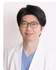
監修：網倉良安先生

体には400万個ほどの汗腺があり、わきがに関係するアポクリン腺は100万個ほどです。しかし体臭が強いとされる人たちは日本人の数倍のアポクリン腺を持っているといわれます。日本人が体臭を気にするのは「無臭」に近い人が多いからかもしれません。