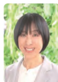
監修：中村 幸代先生

これらのリスクを避けるためには、妊娠中の女性は体温管理をしっかりを行い、必要であれば医師のアドバイスを求めることが重要です。健康的な妊娠生活を送るためにも、冷え対策を心掛けましょう。