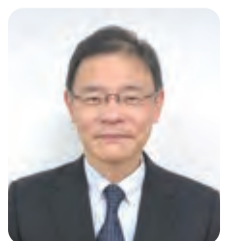
監修：山本 松男先生 昭和大学歯科病院 教授、歯周病科診療科長 日本歯周病学会 歯周病専門医・指導医

ただ適応症を見極めるための事前検査が重要です。治療費もリグロスとGTR法は保険適用ですが、保険適用外の材料があったり、組み合わせると保険適用でなくなったりするケースもありますので、事前に担当医とよく相談する必要があります。